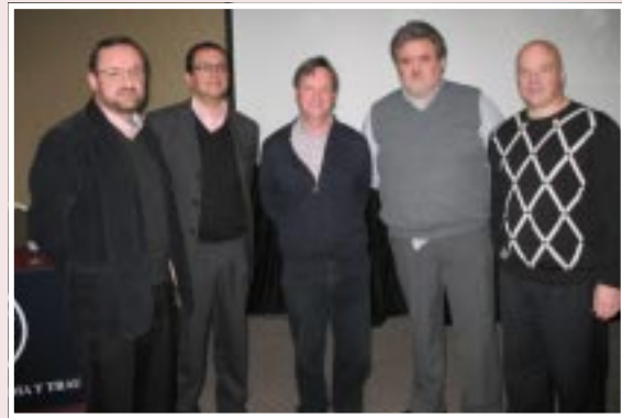
22 de agosto, Conference Town de Reñaca: